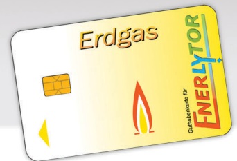
▲ Guthabenskarte Erdgas