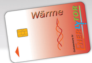
▲ Guthabekarte Wärme