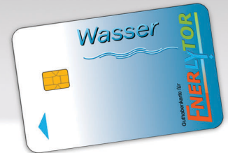
▲ Guthabekarte Wasser